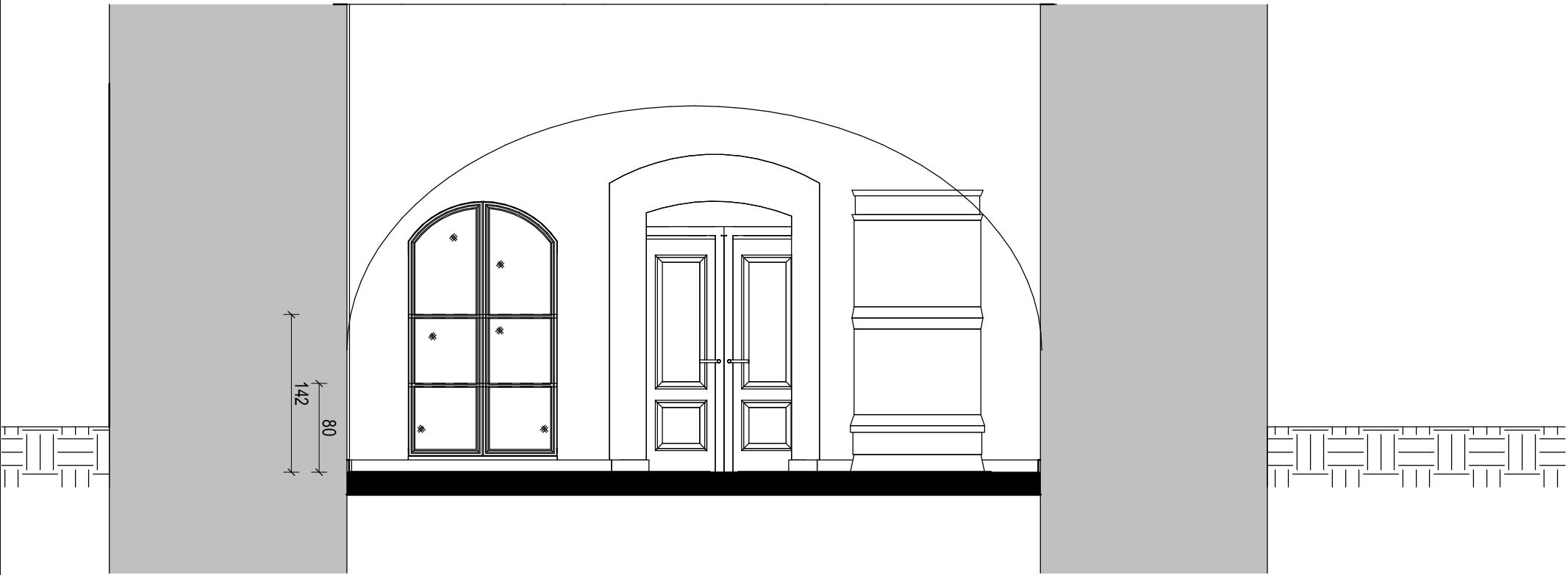
G Aranżacja elewacja północna sala południowa 1 : 50